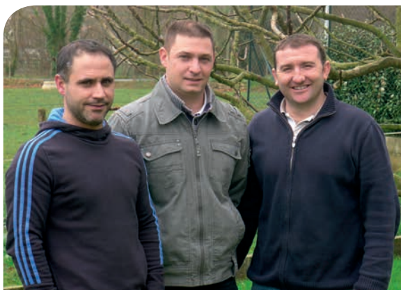
(De gauche à droite, vos adjoints et délégués)

Senpereko gazteriarekin beti izan naiz harreman hurbiletan, erabaki dut gure taldean engaiamendu horren segitzea. Ene nahikaria da gazteen laguntzea, bereziki besta komite, elkarte, herriko zerbitzu (gazte informazio gunea) proiektu desberdinak eremateko gardentasun osoan.